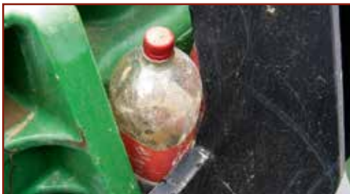
Eredetileg élelmiszerek tárolására szolgáló PET palackban veszélyes keverék tárolása

Sajnos napjainkban is jellemző, hogy például ásványvizes vagy üdítőitalos flakonokba veszélyes anyagot/keveréket töltenek, amelyből történő véletlen fogyasztás súlyos egészségkárosodáshoz vezethet. A kémiai biztonsággal kapcsolatos további előírásokat külön jogszabályok, a kémiai kóroki tényezők hatásának kitett munkavállalók egészségének és biztonságának védelméről szóló 5/2020. (II. 6.) ITM rendelet és a kémiai biztonságról szóló 2000. évi XXV. törvény tartalmazzák.