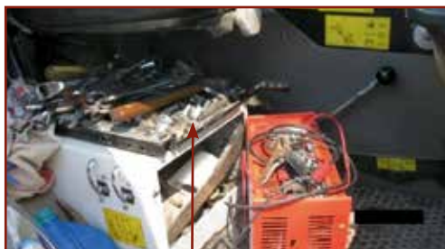
Rögzítetlenül tárolt tárgyak a kezelőfülkében