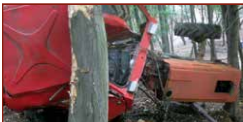
Az erdészetben használt mezőgazdasági traktor felborult, a fülkéje széttroncsolódott.

Távvezérelt munkaeszközök esetében alapvető követelmény, hogy a munkaeszköznek automatikusan le kell állnia, ha az ellenőrzött vezérlési zóna határára ér. Fontos követelmény továbbá, hogy annak a távvezérelt munkaeszköznek, amely rendeltetésszerű alkalmazási körülmények között a munkavállalónak ütközhet, vagy őt valaminek nekiszoríthatja, rendelkeznie kell olyan biztonsági berendezéssel, amely az összeütközés és összenyomás veszélyét kiküszöböli vagy csökkenti.