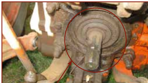
A teljesítmény leadó tengelyről hiányzik a védőharang

Mozgásban levő erő- és munkagépre fel- és leszállni nem szabad.