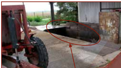
Fedetlen külső beöntő garat