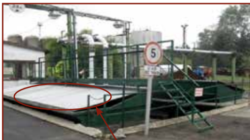
A használaton kívüli beöntő garat lefedése

Az aknák, padlócsatornák, beömlőnyílások, ledobó-nyílások, 0,8 méternél magasabban vagy mélyebben található kezelőhelyek esetében lefedéssel (akár 0,04 m-nél nem nagyobb osztás-közű acélráccsozattal) vagy védőkorláttal kell védekezni a be-, leesés veszélye ellen. Részletes előírásokat további jogszabályok, a Mezőgazdasági Biztonsági Szabályzat kiadásáról szóló 16/2001. (III. 3.) FVM rendelet és a munkahelyek munkavédelmi követelményeinek minimális szintjéről szóló 3/2002. (II. 8.) SzCsm-EüM együttes rendelet tartalmazznak.