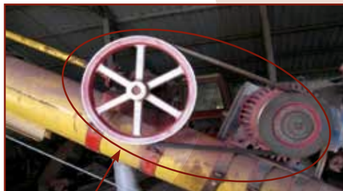
Védőburkolat nélküli ékszíjhajtású szállítócsiga

Veszélyforrást jelenthet például: a felhordó, átfejtő, leválasztó csigasorok, a garatok, ékszíjhajtások védőburkolatainak hiánya.