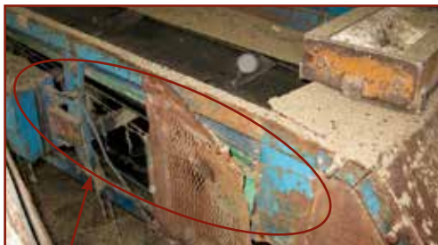
Sérült védőburkolatú szállítószalag

A munkaeszközt mindig a gyártói utasításnak megfelelően kell felállítani, használni! Biztosítani kell, hogy a kezeléskor elegendő tér álljon rendelkezésre!