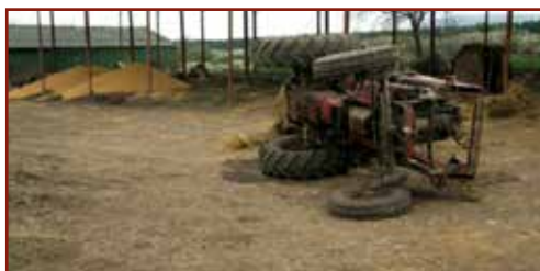
Felborult a fülke nélküli traktor. A munkavállaló a gép üléséből kizuhant, majd a gép átfordult rajta.