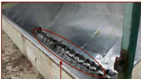
Burkolatlan fogadó garat