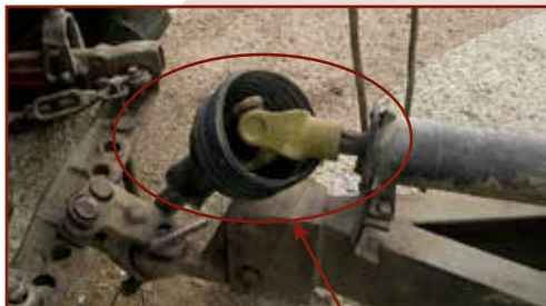
A kardántengely védőburkolata hiányos