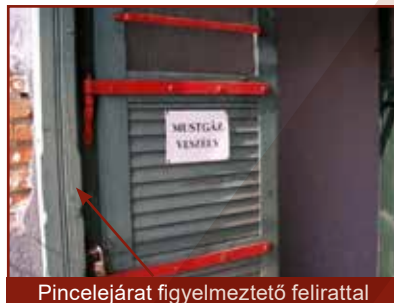
Pincelejárat figyelmeztető felirattal

A szén-dioxid színtelen, szagtalan, a levegőnél nehezebb gáz, ami a levegőt kiszorítva a pincék, üregek, helyiségek alján terül el. Nagy mennyiségben keletkezik szerves anyagok, cukortartalmú növények és gyümölcsök erjedése során is.