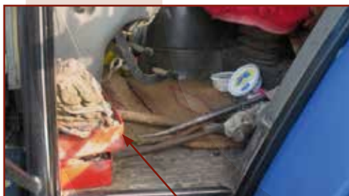
Rögzítetlenül tárolt tárgyak a kezelőfülkében

Munkagép elhagyásakor az akaratlan elmozdulást és az illetéktelen személy általi elindítást meg kell akadályozni.