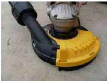
2. ábra Csiszoló az eszközre szerelt elszívóval

A porfogó a helyi szellőztetőrendszer legfontosabb része (lásd a 2. ábrát). Gyakran a szerszámgépek részeként gyártják, de egy meglévő berendezésre utólag is fel lehet szerelni. A nem megfelelő tervezés vagy a porfogó károsodása jelentős hatással van a por visszaszorítására.