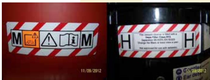
3. ábra Címke az M és H osztályú elszívó berendezéseken

Az elszívó berendezés olyan, mint egy ipari porszívó. Ez egy hordozható berendezés és a helyi szellőztetőrendszer fontos része is egyben. Az elszívó berendezés a porfogóból eltávolítja a port, megszűri, majd tárolja a biztonságos ártalmatlanításáig. Fontos, hogy az elszívó berendezés megfeleljen a szilícium-dioxidra vonatkozó előírásoknak, azaz M (közepes) vagy H (magas) osztályú berendezés legyen. Az elszívó berendezéseket külön címkével látják el (lásd az alábbi 4. ábrát).