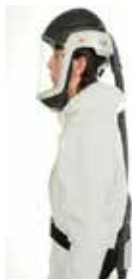
7. ábra Levegőrásegítési sisak

Valamely légzésvédő eszköz helyszíni ellenőrzése során a munkavédelmi ellenőrzést végző szakembernek a nemzeti jogszabályokkal és szabályozási kerettel összhangban meg kell vizsgálnia a megfelelő beavatkozás lehetőségét, amennyiben az alábbiakat figyeli meg: