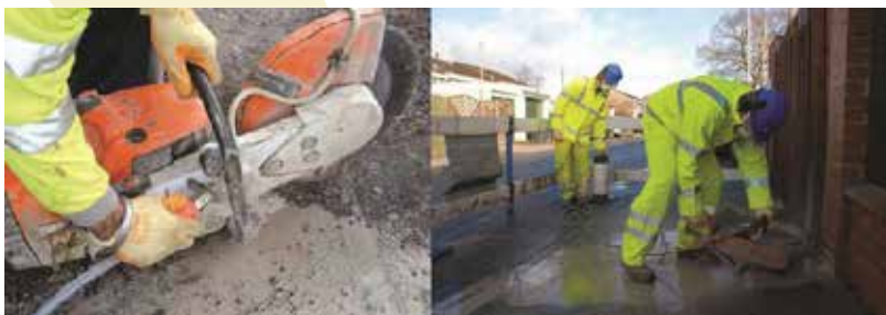
1. ábra Vízpermetező rendszer (forrás: HSE, Nagy-Britannia)

A helyszíni ellenőrzés során a munkavédelmi ellenőrzést végző szakembernek meg kell vizsgálnia milyen megfelelő intézkedést szükséges hoznia a nemzeti jogszabályokkal és szabályozási kerettel összhangban, amennyiben az alábbiakat figyeli meg: