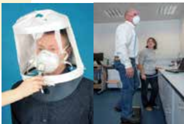
5. ábra minőségi és mennyiségi illeszkedési vizsgálat

Belélegezhető kristályos szilícium- dioxid expozíció esetén olyan típusú légzésvédő eszközt kell választani, amely legalább egy FFP3 légzésvédővel azonos védelmet nyújt. A ténylegesen kiválasztásra kerülő légzésvédő eszköz azonban a feladat jellegétől, a munkakörnyezettől és a viselőjétől is függ, egyes esetekben magasabb fokú védelemre lehet szükség. Egyes tagállamokban előírás a szorosan illeszkedő álarcot illeszkedési vizsgálatnak alávetni, annak ellenőrzésére, hogy az illeszkedik-e a viselő arcához és megfelelően zár- e. Az illeszkedési vizsgálat lehet minőségi (a viselő szubjektív értékelése, azaz egy vizsgálati anyag érzékelése alapján) vagy mennyiségi, speciális felszereléssel végzett mérés (6. ábra). A munkavállalóknak frissen borotváltknak kell lenniük ahhoz, hogy a szorosan illeszkedő álarc hatékonyan elzárja az arcot. A hosszú haj vagy más arcszőrzet akadályozhatja a záródást. A légzésvédő eszköznek CE-jelöléssel kell rendelkeznie, ami jelzi a megfelelést az egyéni védőeszközre vonatkozó minimális termékbiztonsági és munkavédelmi követelményeknek.