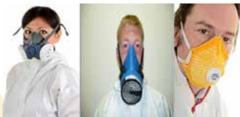
4. ábra Többször használható légzésvédő fél-álarcok és FFP3

A szűrő típusú légzésvédők több modellel kapható, amelyek lehetnek szorosan az arcra illeszkedő darabok (álarcok) vagy lazán az arcra illeszthető darabok (csuklyák/sisakok). Általánosságban az építési munkahelyeken egyszer, illetve többször használatos légzésvédő fél-álarcokat alkalmaznak (mindkettő szorosan illeszkedő védőeszköz) (lásd az 5. ábrát). Néha levegőrásegítőes kármzsákat/sisakokat, illetve légzésvédő teljes álarcot is viselhetnek. Szemcseszóráshoz frisslevegős, légbefúvásos szemcseszűrő sisakot kell viselni.